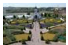
ローズマリー公園