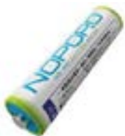
水電池 NOPOPO 水を入れて発電し、 再注水で再使用可

関連商品の売れ行きも好調で、ドクターイエローのプラレール（子ども用電車玩具）、駅弁、キットカットなどが販売され、注目を集めているとのこと。その人気を牽引するのは鉄道マニアだけではないようで、「四つ葉のクローバーを探す感覚」で盛り上がる一般の人たちも多いそうです。