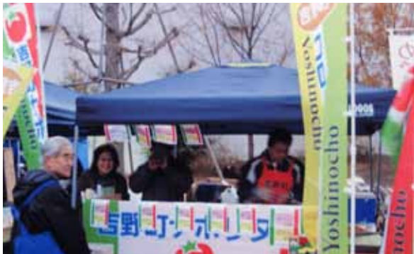
12月18日、午後4時ナポリタン屋台

http://mupd.blog54.fc2.com/blog-entry-432.html