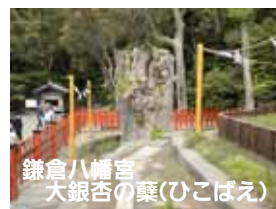
鎌倉八幡宮 大銀杏の葉(ひこばえ)