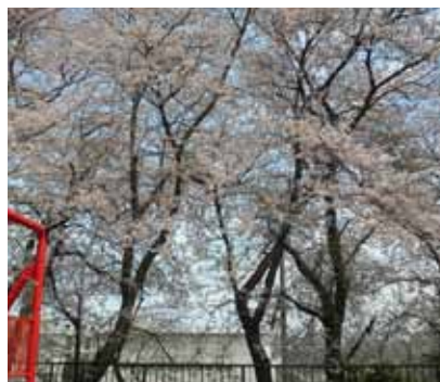
三春台第二公園の桜