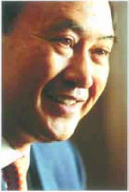
吉野町町内会 顧問 衆議院議員 よしひで すが 義偉