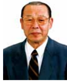
吉野町町内会 顧問