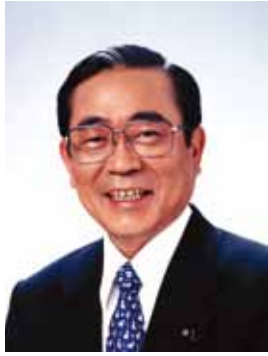
吉野町町内会 顧問