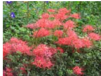
吉野町花壇の彼岸花