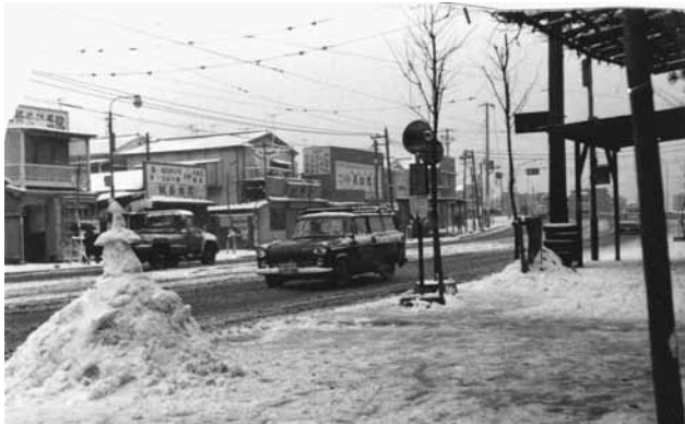
昭和35年頃 雪の日の吉野町1丁目。駿河橋の上に市電が見えます。