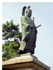
掃部山公 園の井伊 直弼の像 幕末の開 港期に於 ける重要 な人物