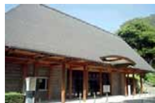
横浜能楽堂。東京根岸の旧加 賀藩主前田斉泰邸に建てられ、 後に染井の松平頼寿邸に移築 されて使用されていたものを 移築復元したもので、関東で は現存する最古の舞台である。