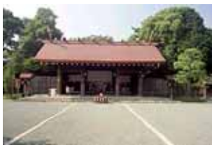
伊勢山皇大神宮。「伊勢」の 名が示すように天照大御神を 祀るこの神社は横浜の町並み を見下ろすように高台に位置 し、樹木に囲まれた静かな佇 まいを持っている。