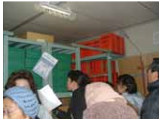
備蓄庫を見学、備蓄品一覽で庫内を確認