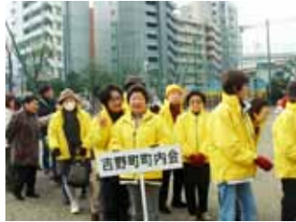
参加した吉野町のみなさん