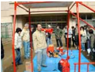
テント式トイレ・発電機・エンジンカッターなどの使用方法的説明