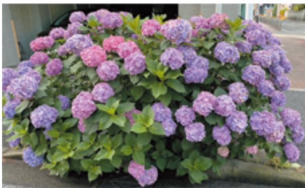
南吉野町5丁目の紫陽花がきれいに咲いてました。

今年出来るかと気を揉んでいましたが、神輿連合渡御は、今年も中止となりました。なお式典、出店、演芸提灯飾りの行事は、通常通りの予定です。詳細は、7月28日の全祭礼委員会後、吉野町の祭礼予定をお知らせいたします。