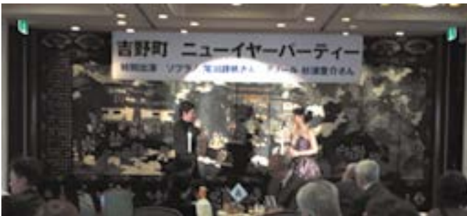
13代目会長の新年ご挨拶