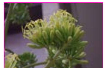
リュウゼツランの花