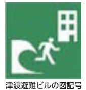
津波避難ビルの図記号

★鉄道の運行停止等により、多くの人々が駅周辺に集まることは危険です。交通情報などに注意し、むやみに移動を開始しないようにしましょう。